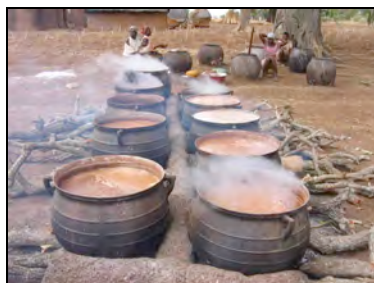
Préparation de la bière de mil dans un village Sombas

Koutammari kou 2, rue du Moulin-Neuf – 85450 Sainte-Radégonde-des-Noyers Tél. : 02 51 30 89 38 – 06 12 58 40 85 Courriel : koutammarikou@yahoo.fr Site Internet : www.koutammarikou.com