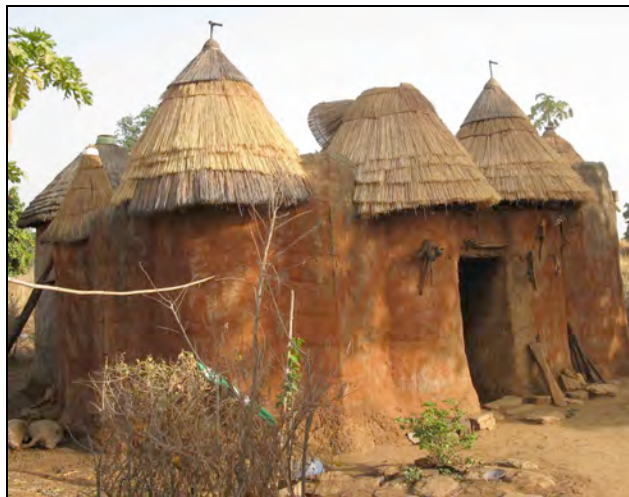
Le tata, habitat traditionnel de l'ethnie Somba